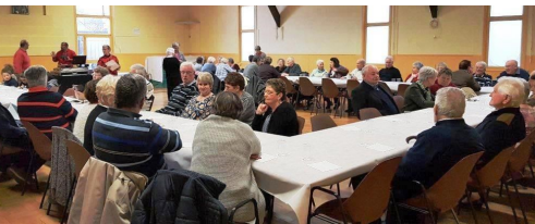
Galette du C.C.A.S... page 5