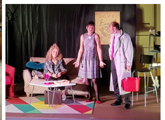
Une après-midi de rigolade... page 6