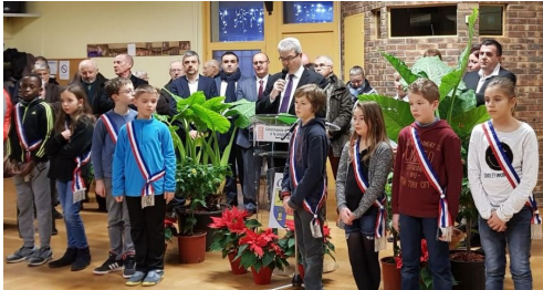
Cérémonie des vœux... page 4